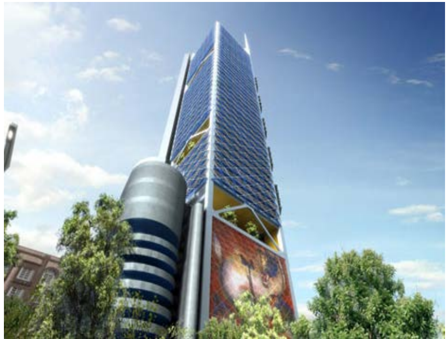
Future torre de BBVA Bancomer que se encuentra en construcción en la Ciudad de México.

El Grupo BBVA tenía registrados a 31 de diciembre de 2012 un total de 9.871 millones de euros en impuestos diferidos de activo, y un total de 2.883 millones de euros en impuestos diferidos de pasivo.